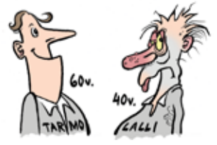
Oma kunto, oma vireys?