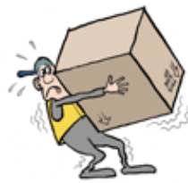
Kiire. Oikeat menetelmät.