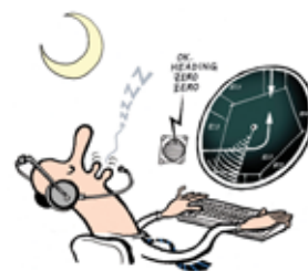
Väsymys? Riittävä yöni.