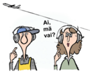
Olenko minä mukana tässä sarjakuvassa?