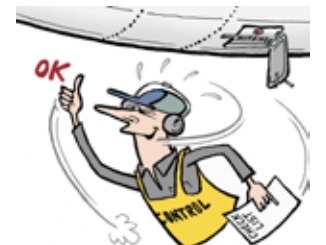
Kiire. Liika yrittäminen.