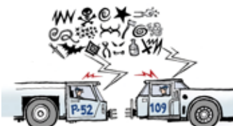
Viestintä- ja kommunikointitaito